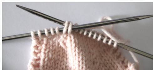
2 m. end. ens. t.

Piquez dans le brin arrière de la première maille de l'aiguille droite puis dans celui de la seconde maille, l'aiguille allant vers vous cette fois.