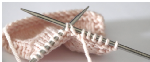
2 m. env. ens.

Piquez dans le brin avant de la première maille de l'aiguille droite puis dans celui de la seconde maille.