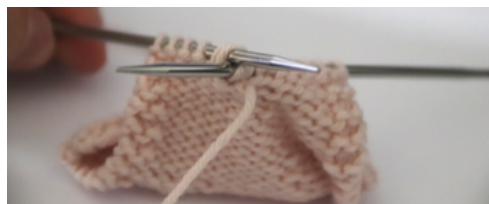
2 m. env. ens. t.

Piquez dans le brin arrière de la seconde maille de l'aiguille droite puis dans celui de la première maille.